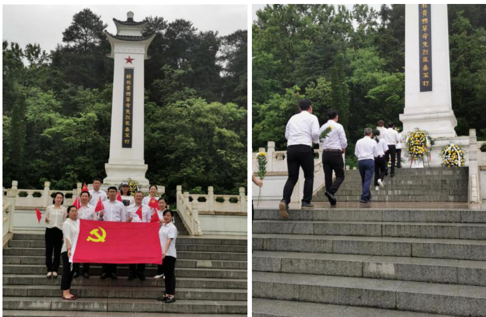
（急救重症党支部开展“缅怀先烈，牢记使命”为主题的红色教育活动）