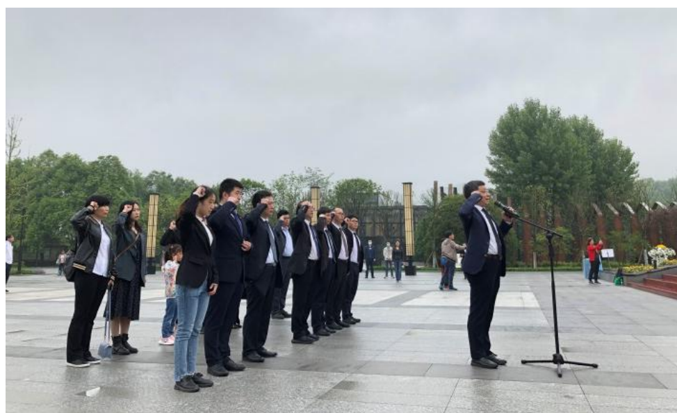
（消化内科、皮肤美容科和输血科全体党员开展主题为“缅怀先烈，传承精神”的党日活动）