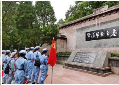
（超声医学中心党（团）支部特举办了“不忘初心、重温遵义会议精神，牢记使命、重走红军长征路”的主题党日活动）