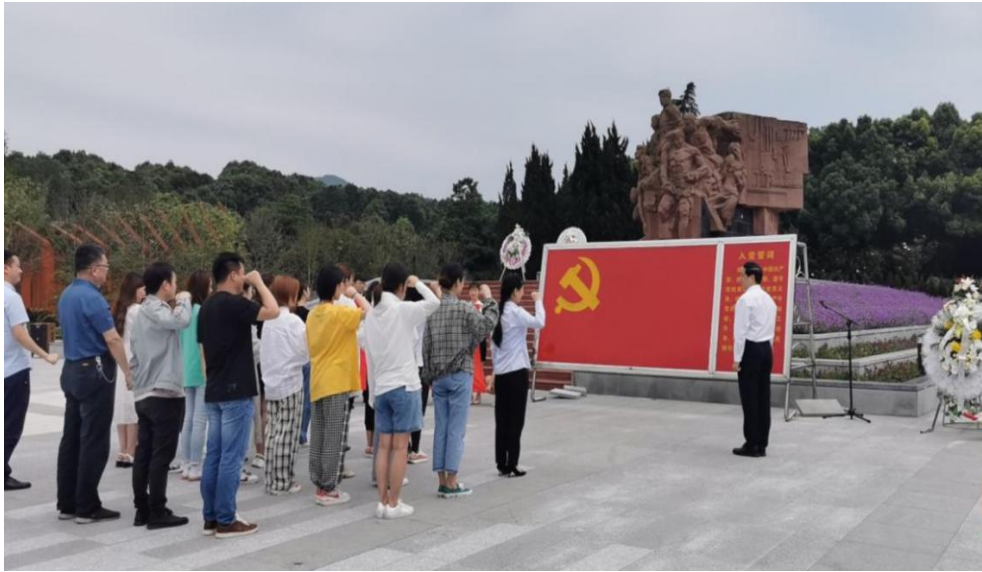
（心血管内科全体人员赴息烽集中营革命历史纪念馆 开展主题为“缅怀先烈”的党日活动）